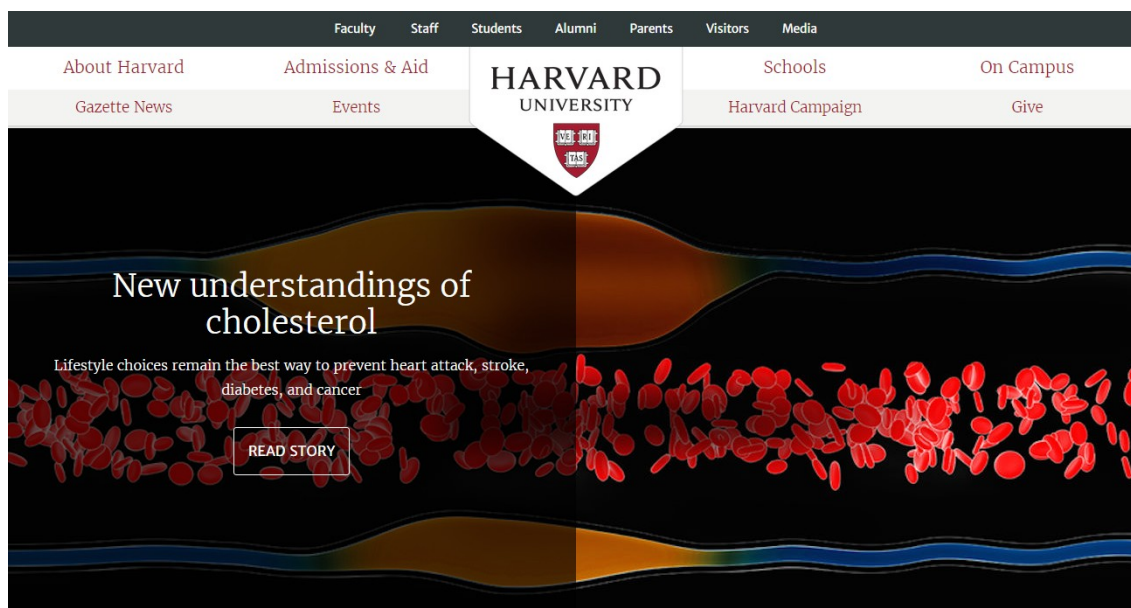
1. kép. A Harvard főoldalának tetején külön vannak szedve a tartalmak a diákok, látogatók, szülők, munkatársak stb. szükségletei szerint

beépíteni, ami nem sikerült maradéktalanul. Ez a felosztás egy külön, plusz navigációs lehetőség kéne legyen, és a fő tartalmat nem eszerint kéne felosztani.