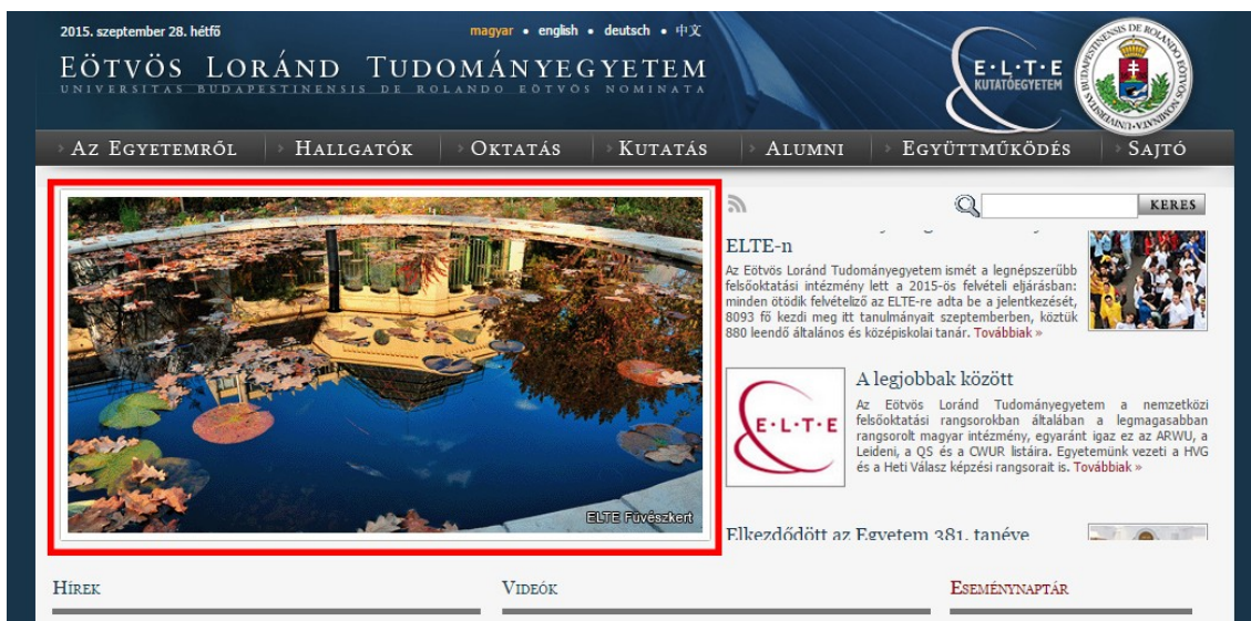
2. kép. A főoldal képváltója kontextus nélküli és az oldal majdnem felét teszi ki.

A hat vizsgált hazai egyetem honlapjából mindegyik kivétel nélkül használt képváltót a főoldal tetején. A kutatások azonban azt mutatják , hogy ez nem csak idegesíti a látogatókat, de a tartalmakat az esetek kilencvennyolc százalékában nem találják meg, annak ellenére, hogy az az orruk előtt szerepel. Sokkal jobb, ha egyetlen egy tartalom van kint, ami azonban nem változik. Alapvető tervezési tényező, hogy semmi se